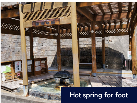
Hot spring for foot