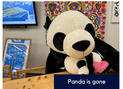
Panda is gone