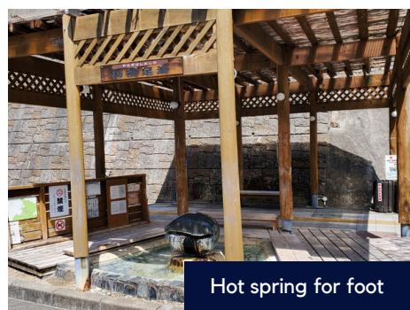
Hot spring for foot