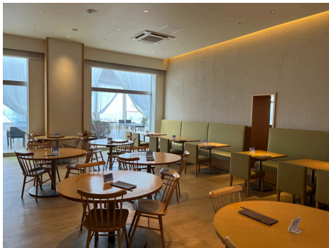
Buffet Restaurant "by the ocean"